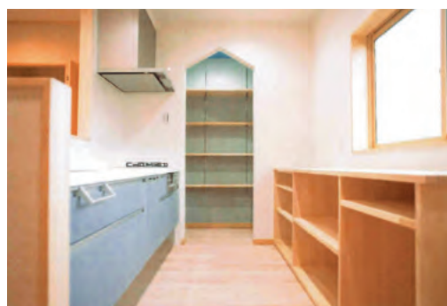
キッチン&パントリー